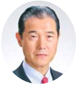
名張市長 亀井 利克