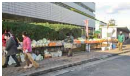
シルバーファーム出店