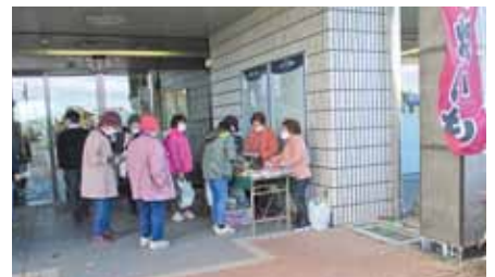
手芸クラブ「百花」販売