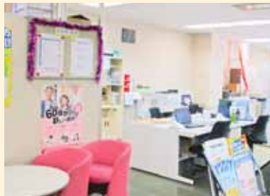
事務所入り口の左側に