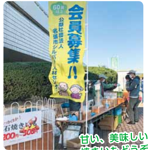
甘い、美味しい 焼きいもどうぞ

ご協力いただきました名張市役所に感謝申し上げます。今後もメンバーは安価で安心して食べていただける新鮮野菜を作ります。応援よろしくをお願いします。