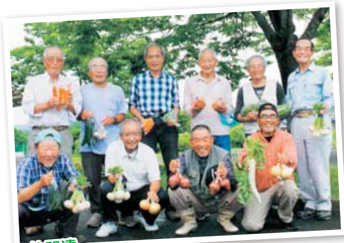
仲間達 若々しいでしょ！