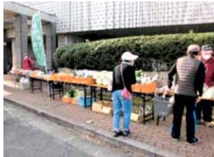
シルバーファームによる野菜の販売