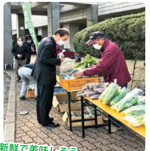
新鮮で美味しそう 買うワ～