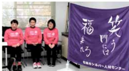
オンラインによる収録風景