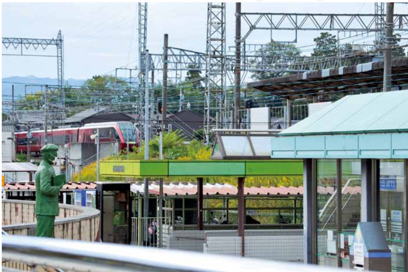
マスクをしている乱歩さんのつぶやき「コロナに負けるな！」(名張駅東口)