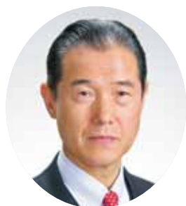
名張市長 亀井 利克