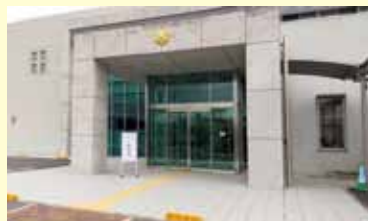
会場 防災センター

令和3年 1月19日・2月16日 3月16日・4月20日 5月18日・6月15日 すべて第3火曜日、10時から