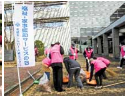
名張市役所での落ち葉掃除